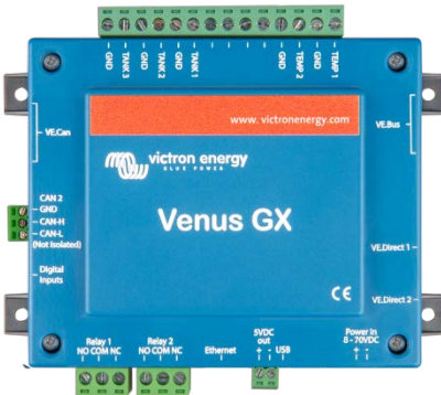
Venus GX avec connecteurs